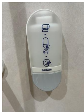
園内の全てのトイレに 便座ディスペンサーを設置