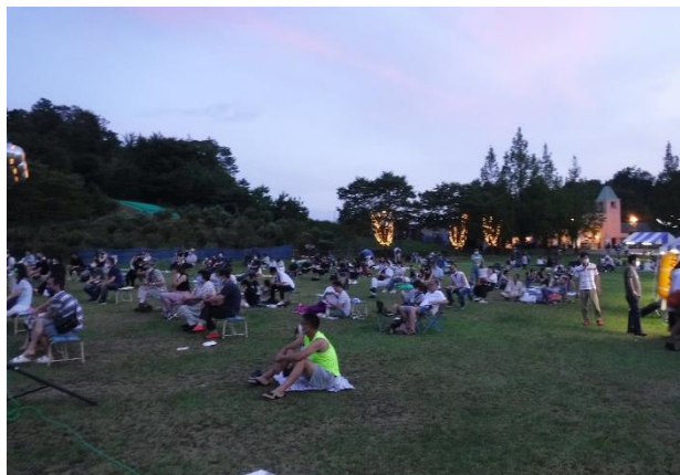
入場者の状況 グループごとに2mの間隔を確保