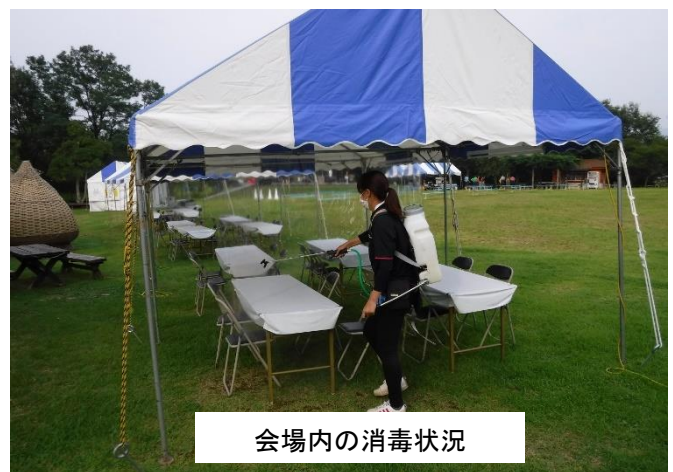
会場内の消毒状況