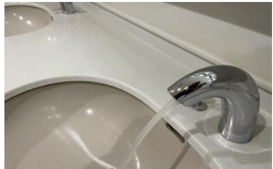
レストラントイレ手洗 手動から自動へ