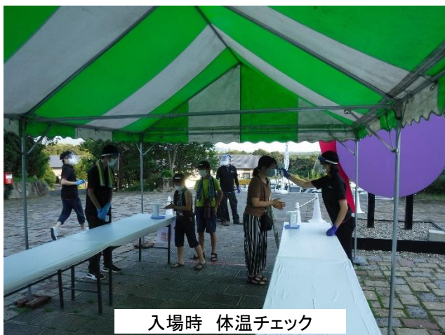
入場時 体温チェック

事前予約制による入場制限や、入場時の体温チェックなど徹底した感染予防対策を実施して開催