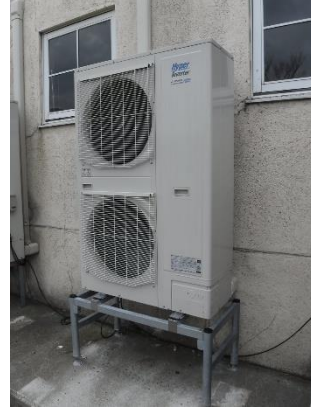
レストラン山と海with日本海牧場