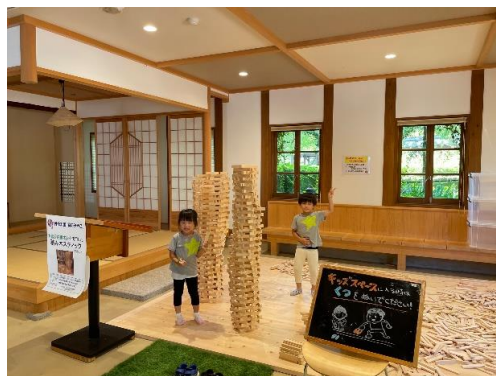
丹後茶寮に開設したキッズルーム

遊休化していた丹後茶寮をキッズルームとして開放するとともに、京丹後市教育委員会との連携により「まちかどピアノ」を設置し、京丹後市民の皆さんや京丹後市を訪れる方にいつでも気軽にピアノを弾いていただける交流の場として提供