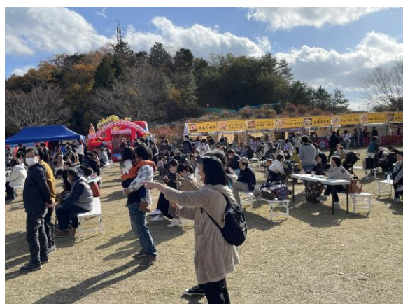
京都丹後「食とペットとスポーツの祭典」