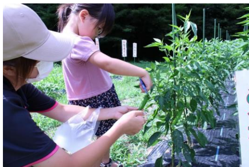
初めて実施した万願寺トウガラシの収穫体験