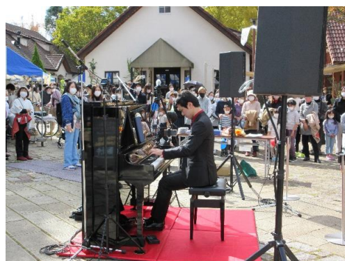
まちかどピアノオープニング記念コンサート