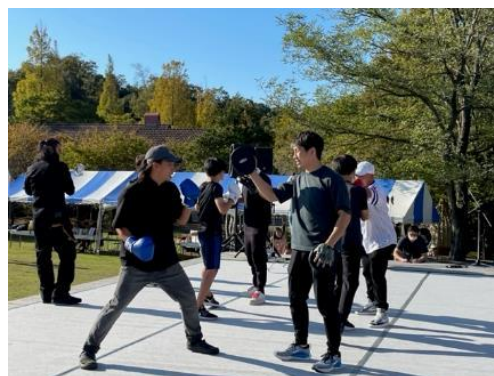
京丹後「食とスポーツ・健康の祭典」 におけるスポーツ体験