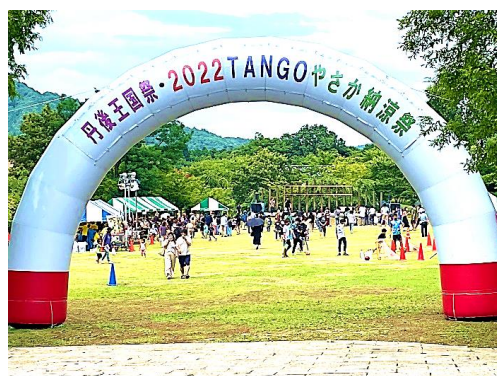
地元実行委員会と共同で開催した 丹後王国祭

「京都・丹後食の王国」プロジェクトの拠点施設として、園内感染拡大防止対策を徹底して、地元農業者、各種団体と連携したイベントを積極的に実施し、コロナ禍で落ち込んだ来園者数の回復に努めるとともに、当施設の広大な敷地や豊かな自然という特徴を活かし、「食」に加えて「気球」、「スポーツ」、「健康」、「ペット」等の新たなファン層の獲得につながる取り組みを行い、京都「丹後・食の王国」構想の推進に努めた。