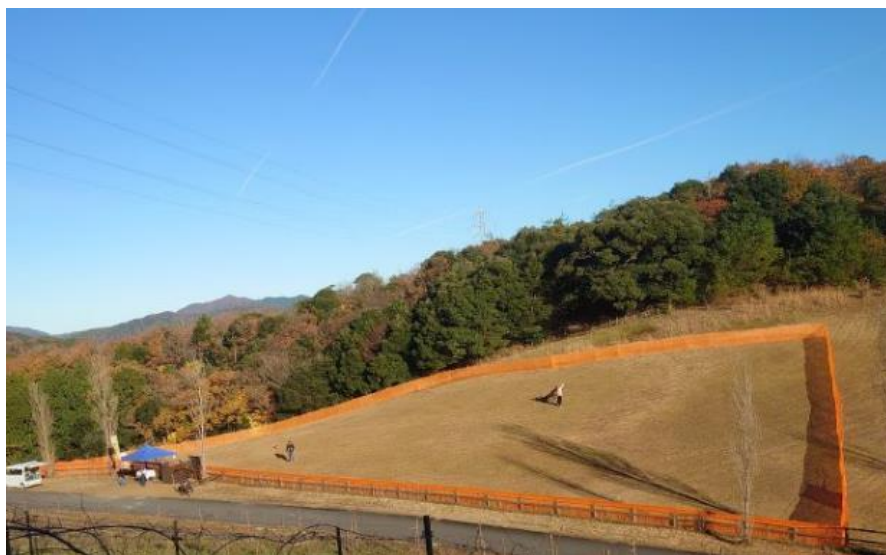
広大なドッグラン

また、11月の京都丹後「食とペットとスポーツの祭典」では、当施設の「自然の中の広大な敷地」という強みを活かして仮設ではあるものの西日本最大級のドッグランを設けたイベントを行うことにより、収入を得ながら施設を運営していくという今後の施設運営のあり方の検討材料となった。