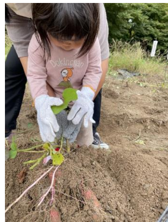
毎年人気のサツマイモ収穫体験