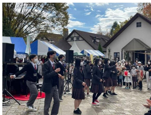
高校生が企画した丹後万博での高校生の活動