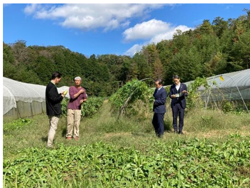
地域商社が調整して開催した農業者とバイヤーとの商談会